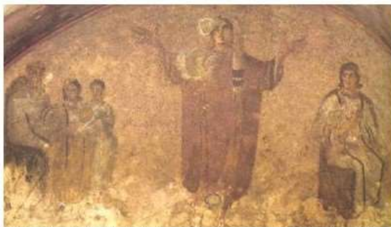
"Cubicolo della Velatio", catacombe di Priscilla a Roma. Donna velata orante. (Metà III secolo)